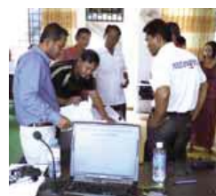
カンボジア王国での小学校体育授業促進のためのワークショップ (2013)

国連の設定したミレニアム目標の達成に向けて、スポーツを通じた開発支援に対する国際的な関心が高まっています。我が国の体育授業の質の高さは、国際的にも評価されており、このリサーチユニットでは体育授業の国際展開をしていきます。平成18年度以降カンボジア王国小学校体育授業支援事業に助言者として参加しています。カンボジアでは教育の根幹である初等教育で体育指導の普及に関わ