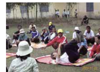
カンボジア王国での小学校教師を対象とした講習会風景 (2008)

国連の設定したミレニアム目標の達成に向けて、スポーツを通じた開発支援に対する国際的な関心が高まっています。我が国の体育授業の質の高さは、国際的にも評価されており、このリサーチユニットでは体育授業の国際展開をしていきます。平成18年度以降カンボジア王国小学校体育授業支援事業に助言者として参加しています。カンボジアでは教育の根幹である初等教育で体育指導の普及に関わ